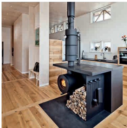
● NR1 KÜCHE MIT HOTPLATE 2 UND WATER