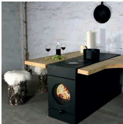
● FT5 KOCHTISCH INDIVIDUELLE BEMESSUNG