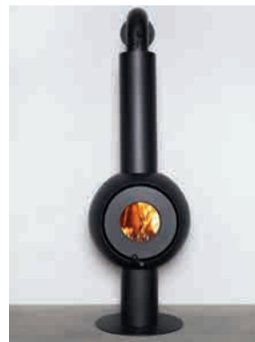
● GLOBE STEEL SKULPTURAL