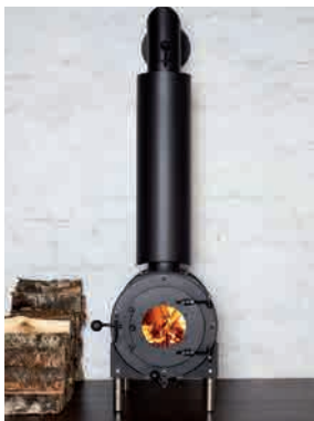
● AIR KONVEKTIONSOFEN