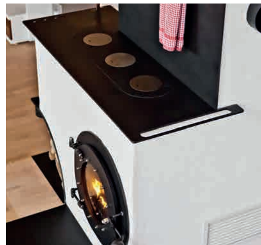
● WP3 HERD MIT HOTPLATE 3