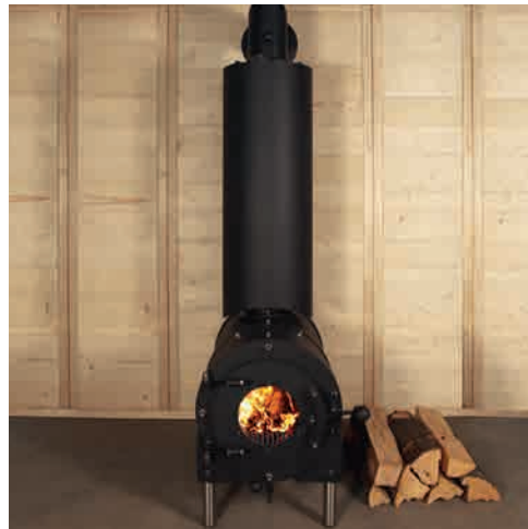
SUURI DER GROSSE