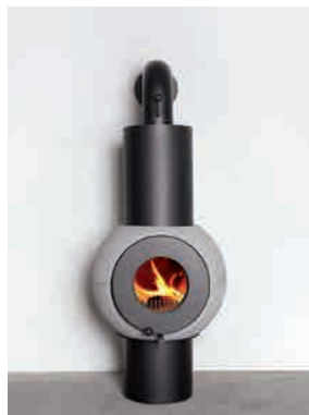
● GLOBE B EINE RUNDE SACHE