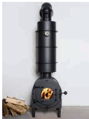
● WATER UNTERSTÜTZUNG