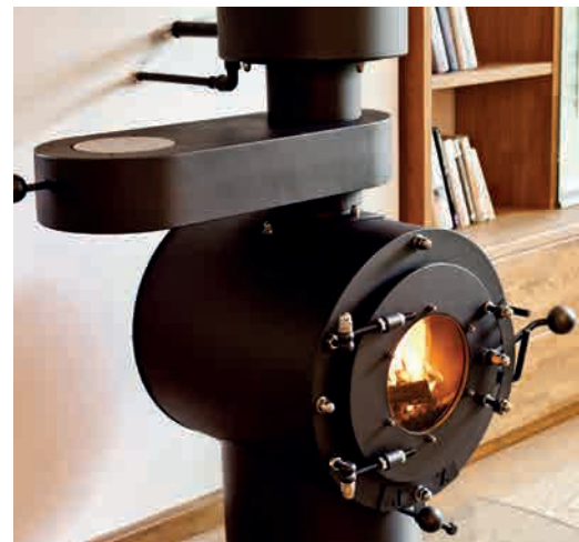
● JK3 HOTPLATE 1