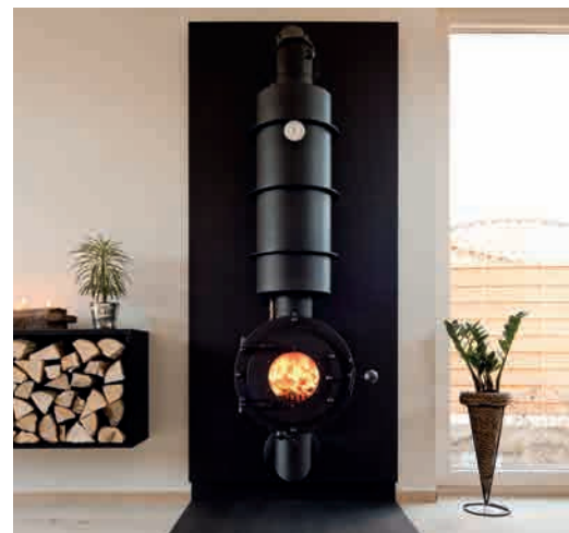
● WB3 WATER WANDHÄNGEND MIT STAHLARBEIT