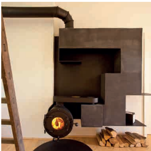
● FT24 KOCHSPEICHEROFEN WANDHÄNGEND MIT HOTPLATE 3