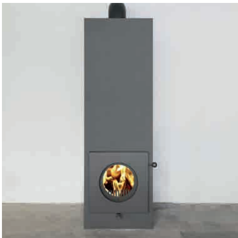
● FT4 WATER S1 MIT GESANDSTRAHLTER OBERFLÄCHE