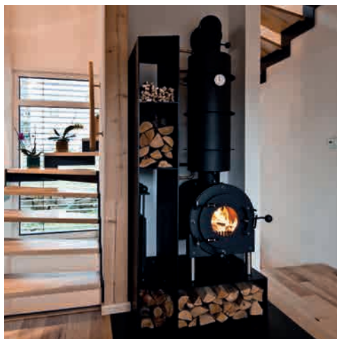
● WB2 WATER MIT STAHLARBEIT