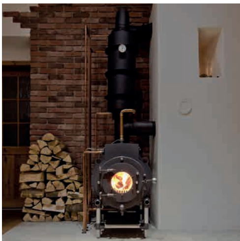
● MP3 H2O WATER MIT SPEICHERZUG