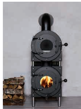
● BAKER MIT KULTCHARAKTER