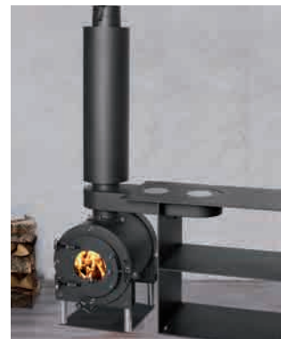
● GOURMET SO KOCHT MAN HEUTE