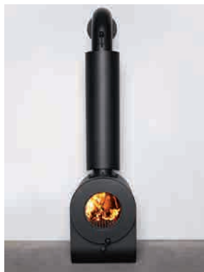
● BULLET FREISCHWINGER