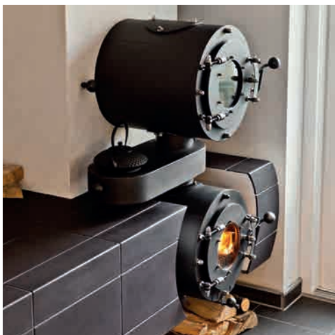
● MM1 BAKER MIT HOTPLATE 1