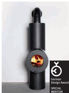
● SHORTY GROSSE WIRKUNG