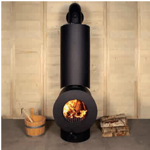
PIKKU DER KLEINE