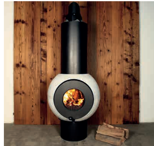
PALLO DIE KUGEL