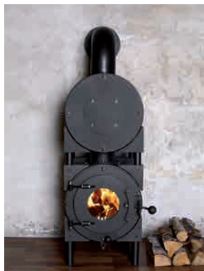
● STORAGE LANGANHALTEND