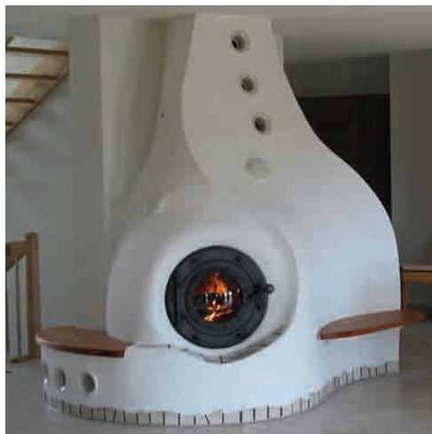
● FT3 EXTENSION WATER IM INDIVIDUALOFEN