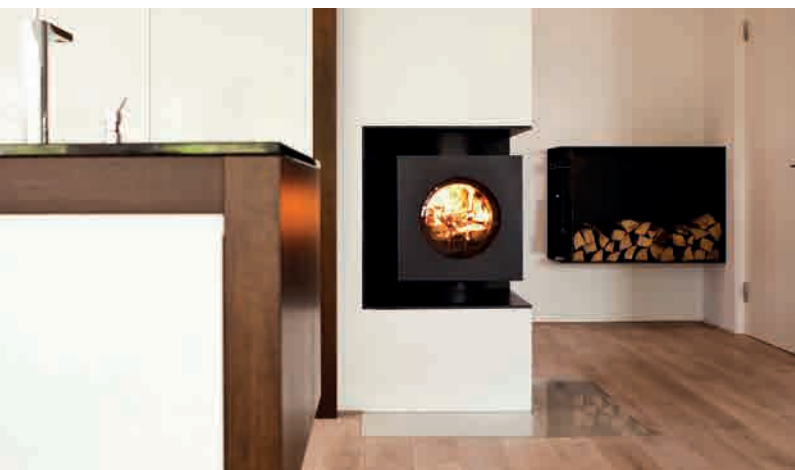
CS1 ● FIRETUBE BURNER SIX Speicherofen, schwenkbar 90°.