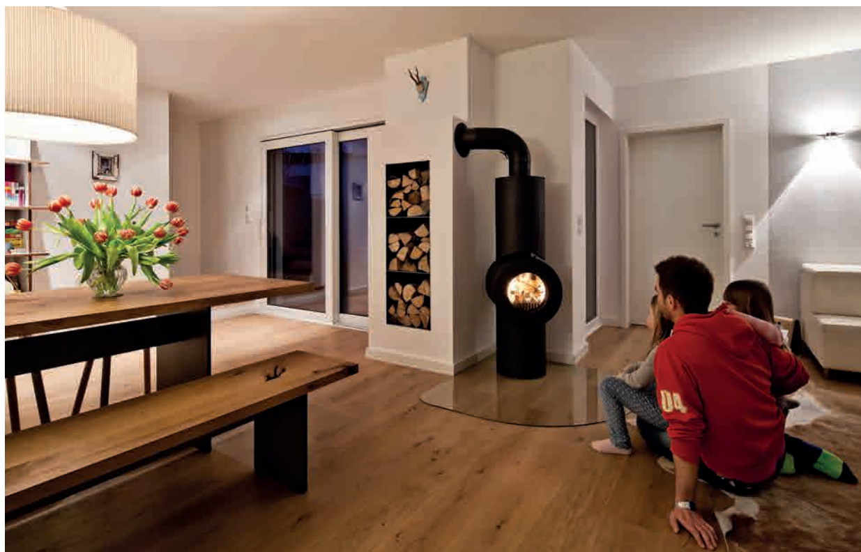
● AZ3 SHORTY