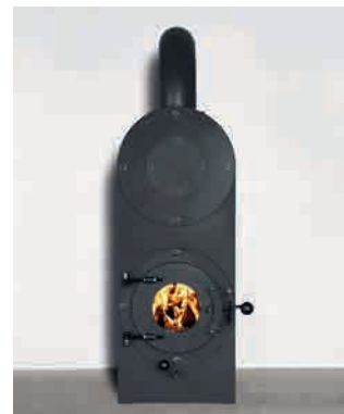
● STAHLTUBE SCHLICHT GERADLINIG