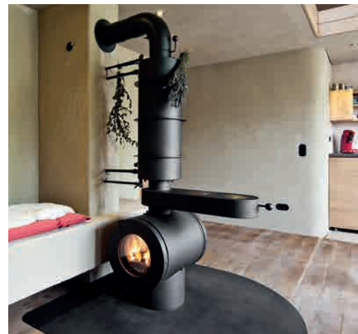
● AW1 WATER MIT SPEICHERZUG UND KOCHPLATTE